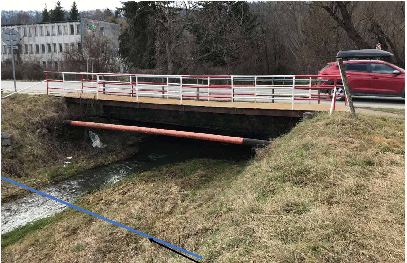
Obr. 2: Pohľad na most na výtokovej strane